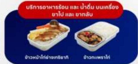
บริการอาหารร้อน และ น้ำดื่ม บนเครื่อง ขาไป และ ขากลับ