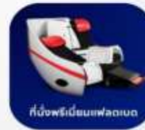
ที่นั่งพรีเอ็มแพลนเบด