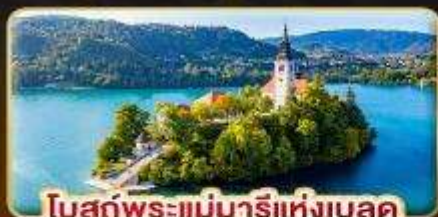
โบสถ์พระแม่มาเรียแห่งเบลด