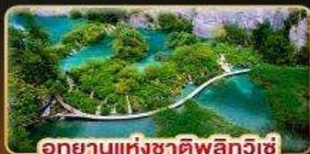
อุทยานแห่งชาติพลิวีเช