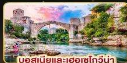
บอสเนียและเฮอร์เซโกวีนา