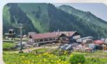
Shymbulak Ski Resort