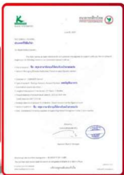
ตัวอย่าง Bank Guarantee ที่ผู้สมัครต้องเตรียมเอกสาร