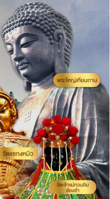
พระใหญ่เทียนถาน