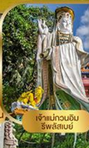
เจ้าแม่กวนอิม ริวลิสมะ