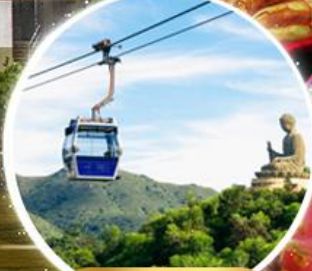
กระเช้าองปิง 360