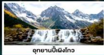
อุทยานปี้เฉิงโกว