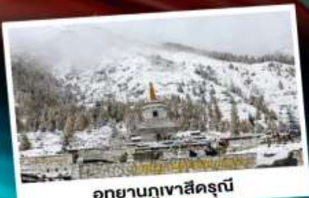
อุทยานกุเวาสีดรุณี