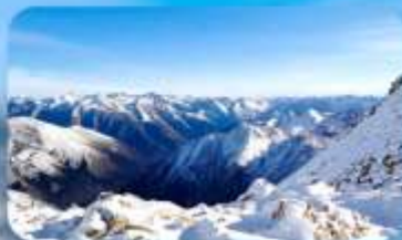
อุทยานคำกู่ปิงชว่น