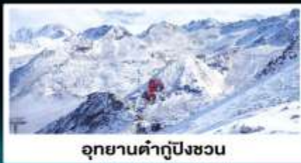
อุทยานคำกู่ปิงซอน