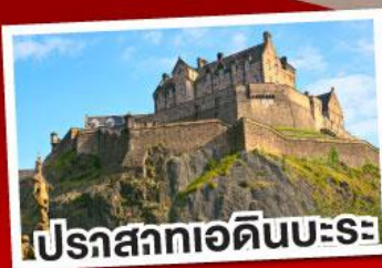
ปราสาทเอ็ดินเบิร์ก