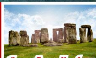
เยือนสโตนเฮนจ์ และ พิพิธภัณฑน์โรมันบาร