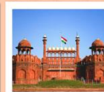
♥♥♥ Agra Fort