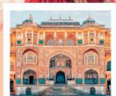
♥♥♥ Amber Fort