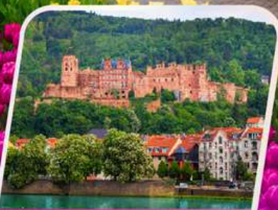
เข้าชมปราสาทไฮเดิลเบิร์ก