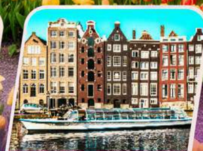
ล่องเรือหลังคากระຈก