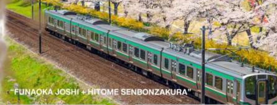
"FUNAOKA JOSHI + HITOME SENBONZAKURA"