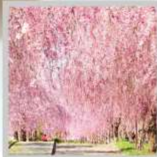
"NICCHUSEN WEEPING SAKURA"