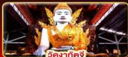
วัดงาทัดจี