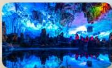
ถ้ำลุย้อ