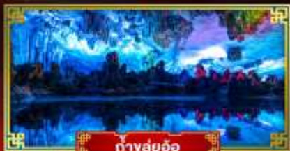
ทิวสวยฉิว

"ดินแดนแห่งสายน้ำและขุนเขา" สัมผัสประสบการณ์นั่งบอลลูนชมวิวมุมสูง