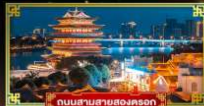
ถนนสามสายสองตรอก