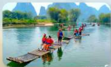
ล่องแพไม้ไผ่หยู่หลง