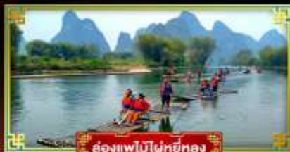
ล่องแพไม้ไผ่หยี่หลง